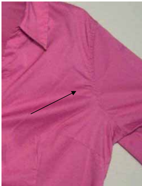
Costura y puntada superior de cobertura

Si el tipo de puntada de sobrecostura o sobrecostura francesa es usada en la costura de los lados, usando dos líneas de puntada cadeneta (ISO-401), el fruncimiento de la costura será muy pronunciado.