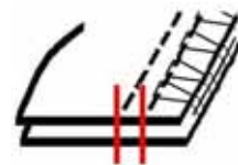
Puntada de doble pespunte (Recomendada)