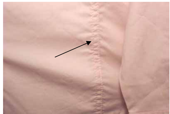
Vista cercana de una costura fruncida

Si el tipo de puntada de sobrecostura o sobrecostura francesa es usada en la costura de los lados, usando dos líneas de puntada cadeneta (ISO-401), el fruncimiento de la costura será muy pronunciado.