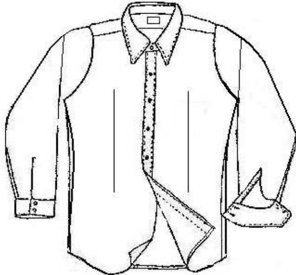
Trazo de una blusa

Si la manga es pegada con la puntada de seguridad (ISO-516) y después es recosida con la puntada de doble pespunte (ISO-301), el fruncimiento será mucho más pronunciado.