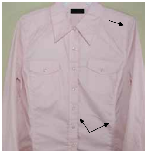
Construcción de costuras complejas – Costuras de los lados defectuosas