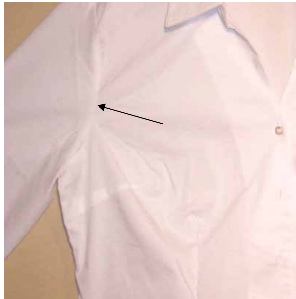
Construcción de costura simplificada