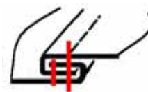
Costura francesa imperfecta