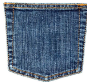
牛仔布口袋未拉伸