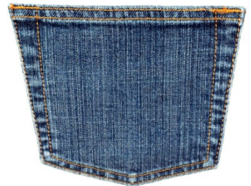
Bolsillo de mezclilla sin estirar | Bolsillo de mezclilla estirado